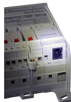
Lastschaltgerät SLflex mit Ethernet-Modul